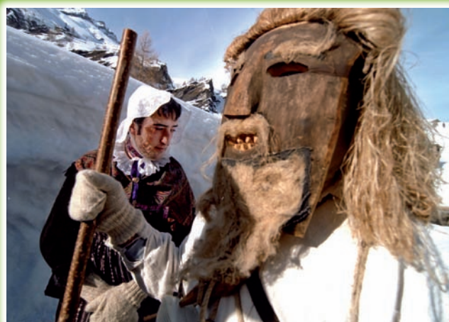
Lou Viei e la Vieio

Indossa l'abituale costume delle donne di Blins :